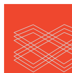
ACCIAIO PER CEMENTO ARMATO