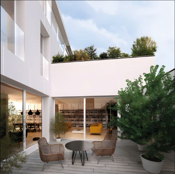
EX CINEMA EDISON - TREVISO (TV)