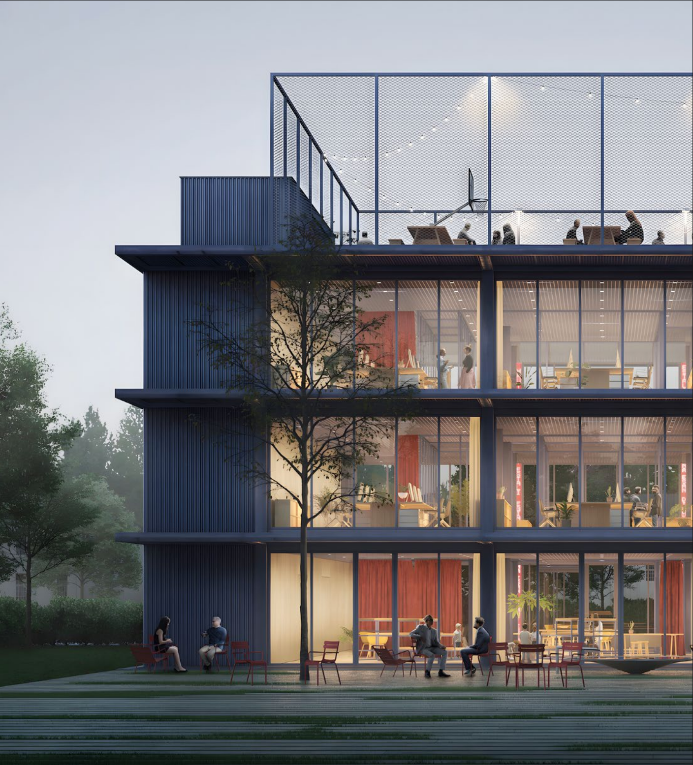
LA SFERA FABBRINI - CARBONERA (TV)