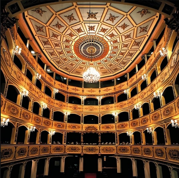
TEATRO COMUNALE - MALTA