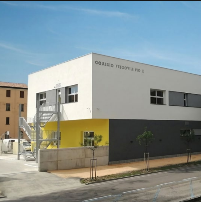
COLLEGIO PIO X - TREVISO (TV)