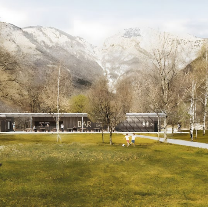
AREA VERDE ATTREZZATA - BUDOIA (PN)