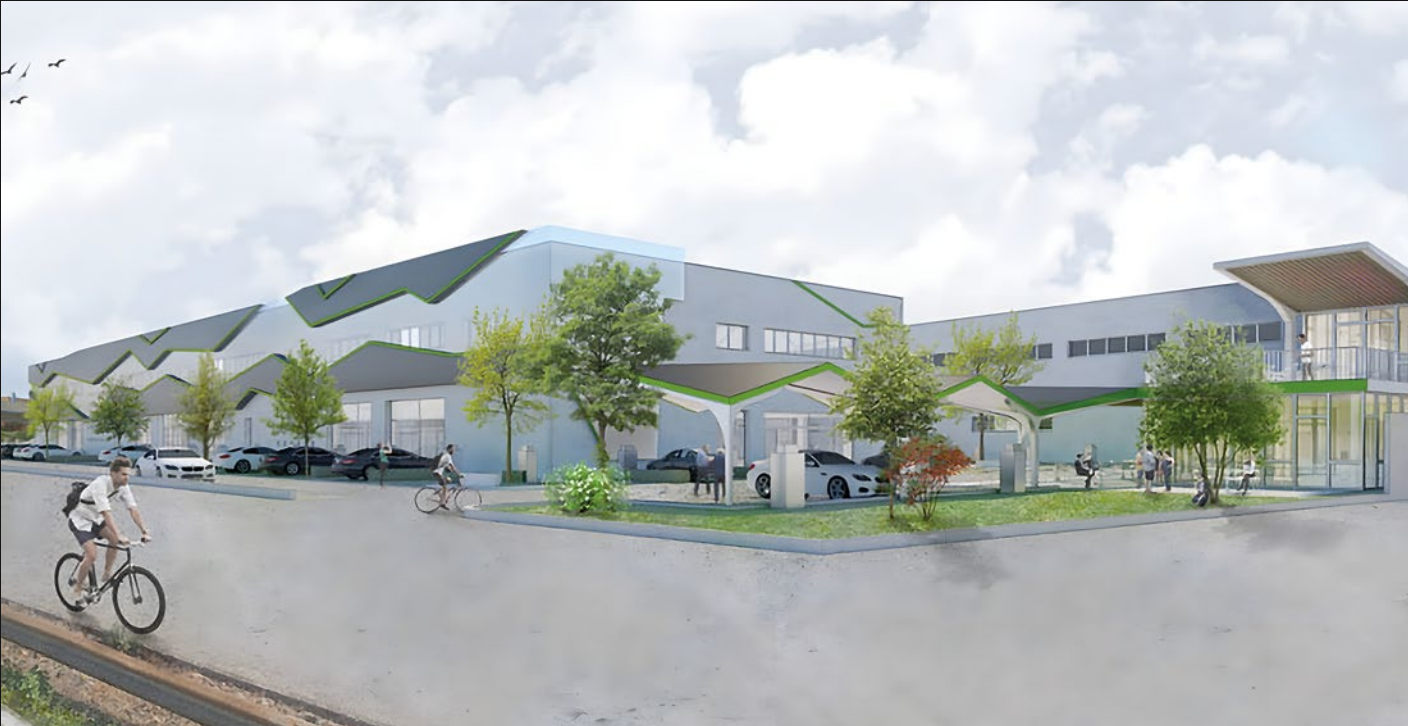
ENERPARK GREEN GROUP - MONTEBELLUNA (TV)