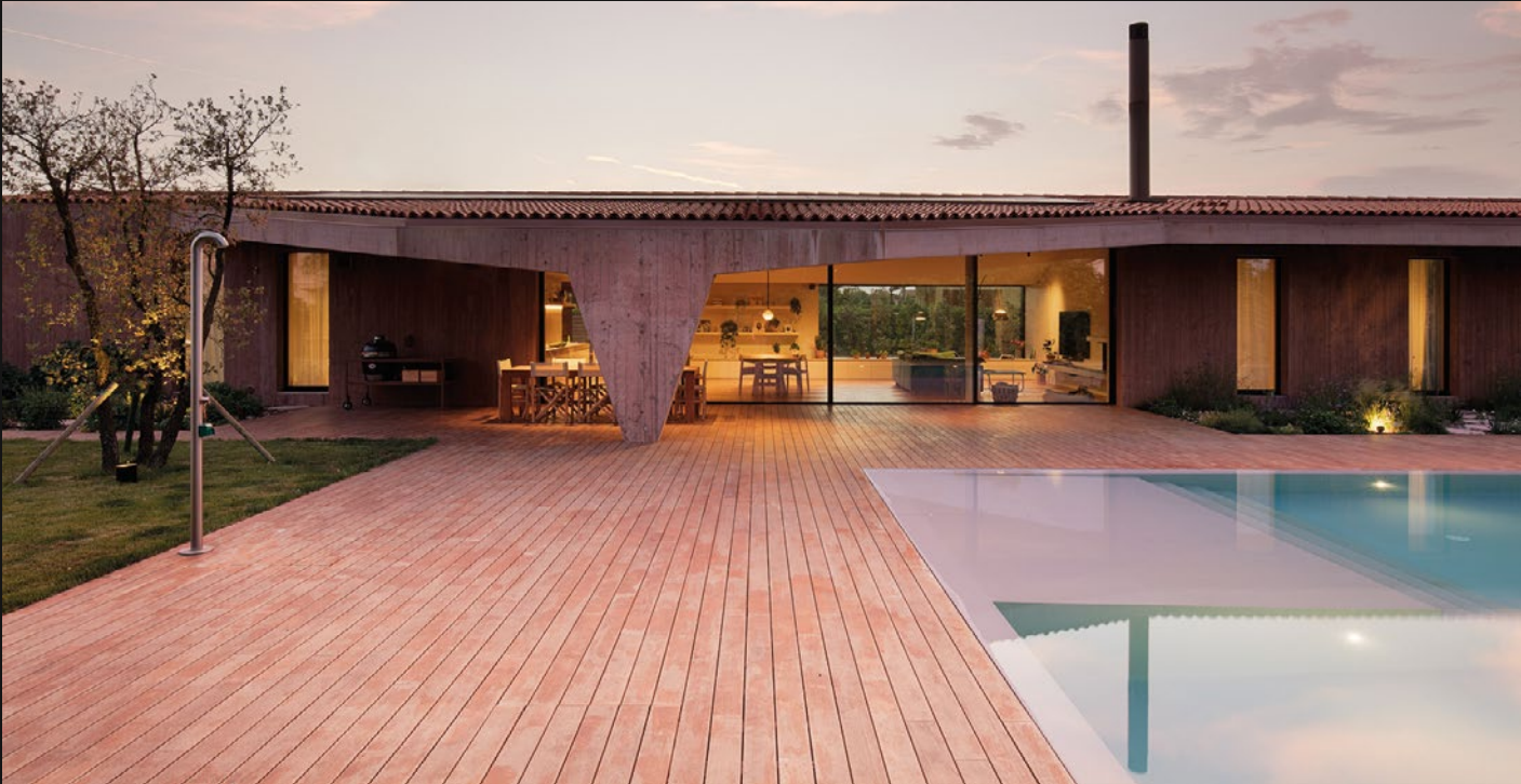
VILLA PRIVATA - VIGODARZERE (PD)