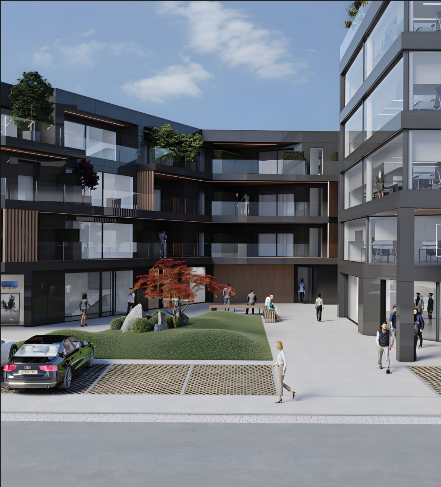
WALFERDANGE - LUSSEMBURGO