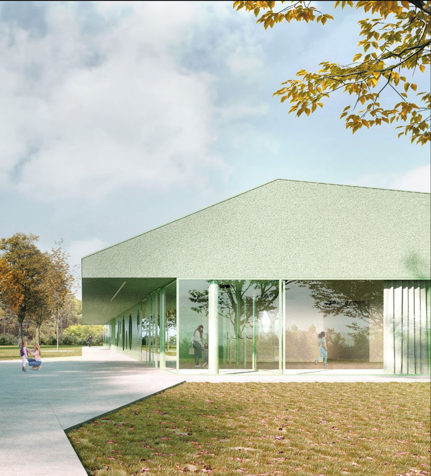
ASILO NIDO - LONGARE (VR)