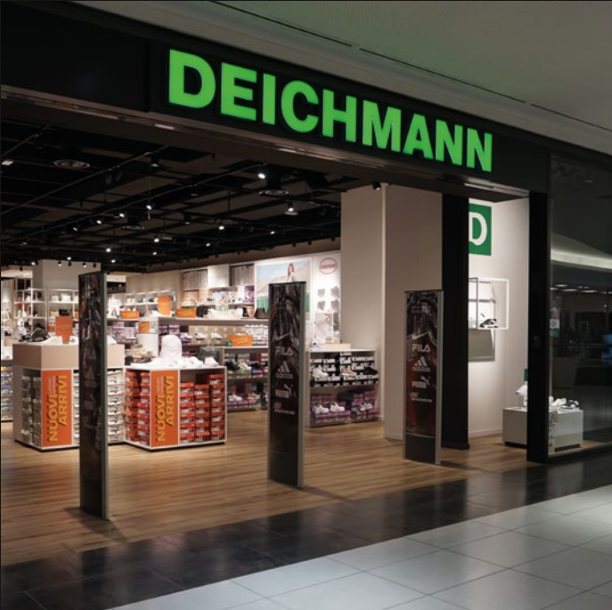
DEICHMANN - MARCON (VE)