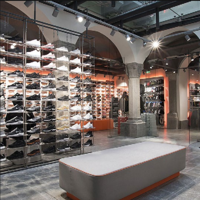
SNIPES - COMO (CO)