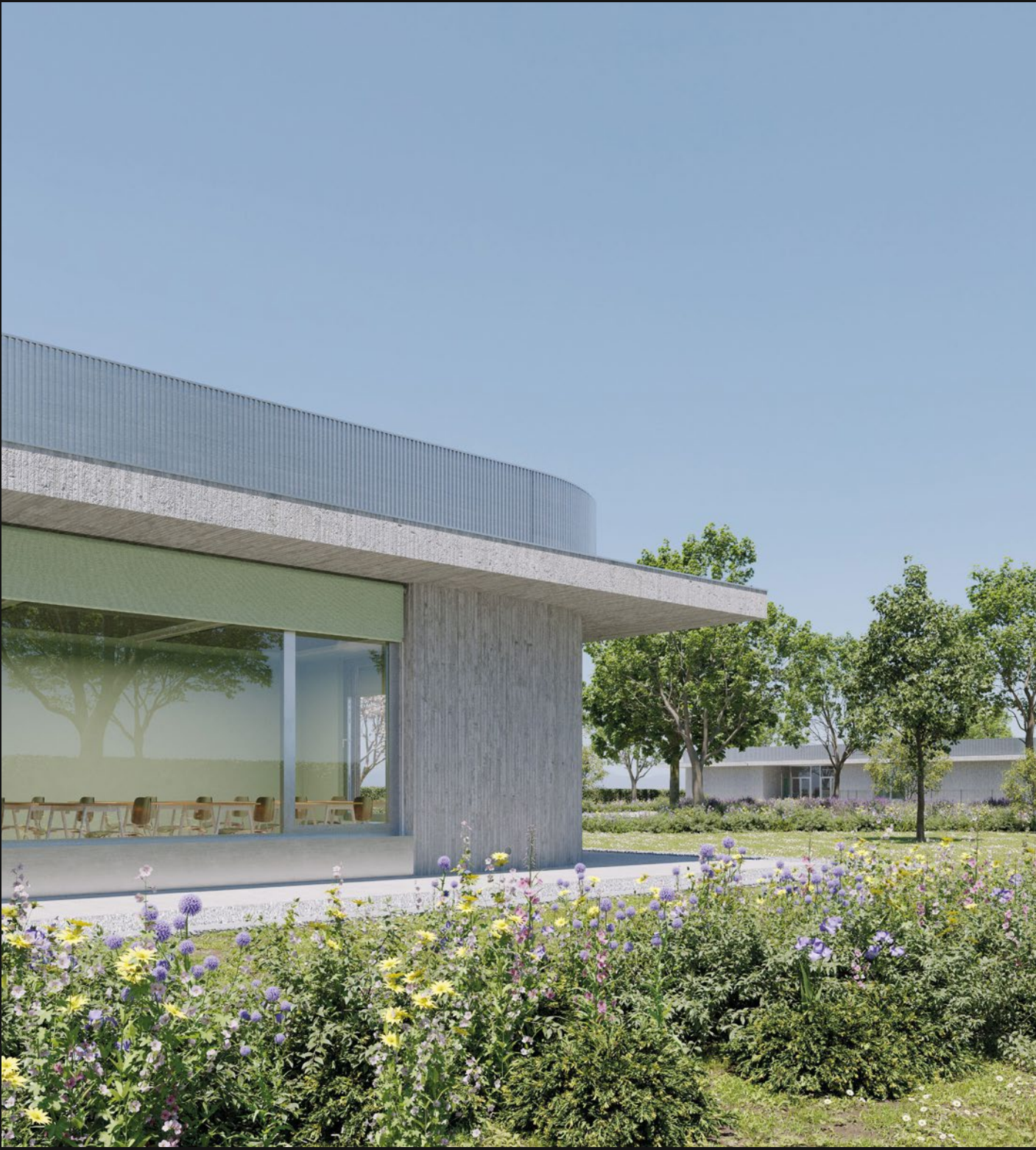
SCUOLA DELL'INFANZIA E SCUOLA PRIMARIA - GORO (FE)