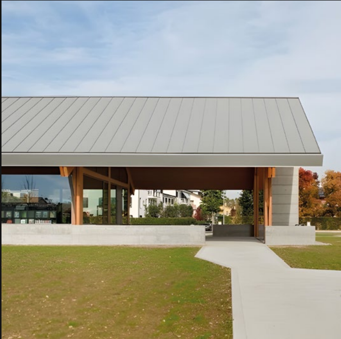
BIBLIOTECA PUBBLICA - VEGGIANO (PD)