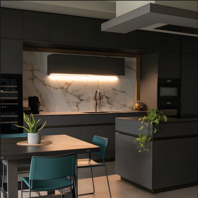
CASA PRIVATA - CASALE SUL SILE (TV)