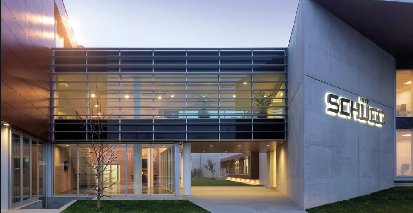
SCHÜCO ITALIA - PADOVA (PD)