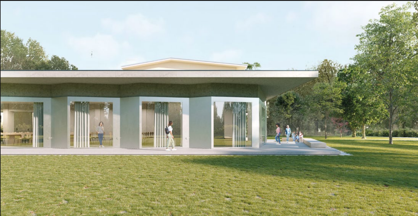
MENSA - PADOVA (PD)