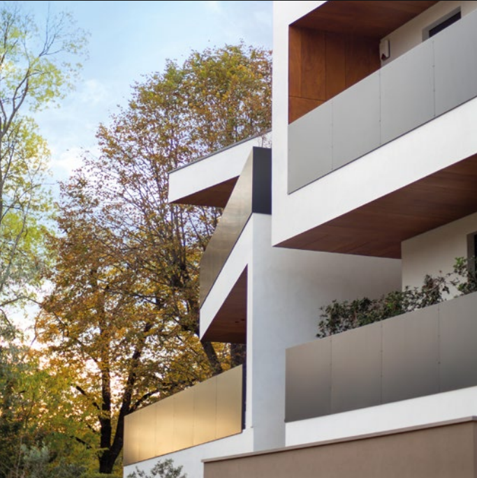
RESIDENCE ELLE15 - TREVISO (TV)