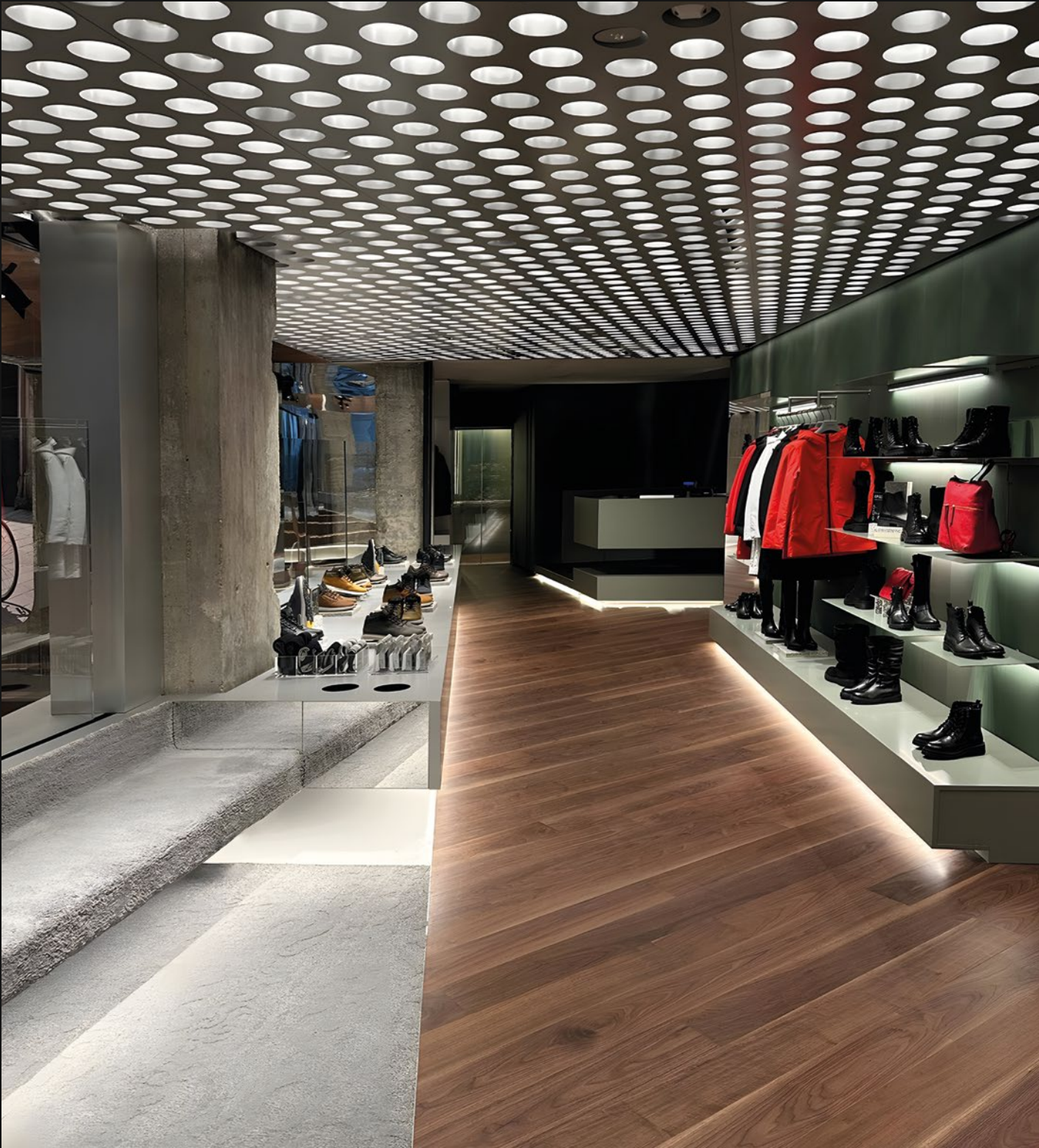
GEOX - MILANO (MI)