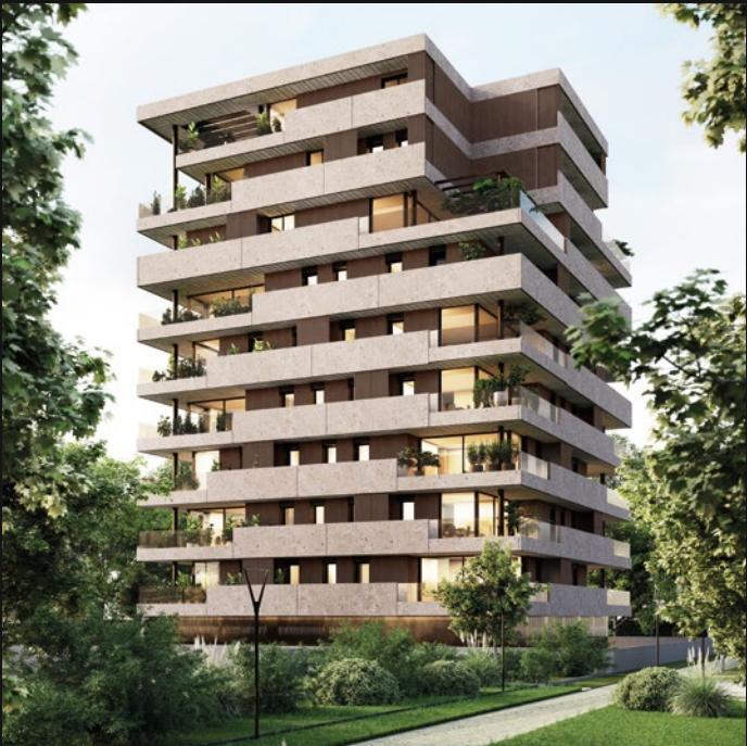
VERTICALITI - CASTELFRANCO VENETO (TV)