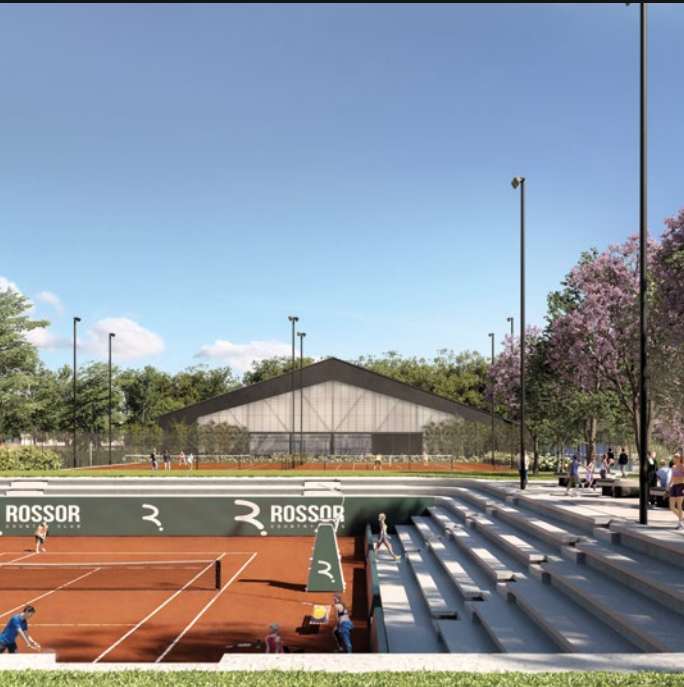
ROSSOR COUNTRY CLUB - VITTORIO VENETO (TV)