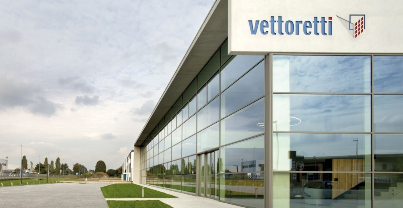
VETTORETTI SRL - CAERANO DI SAN MARCO (TV)