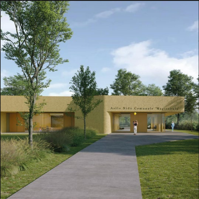
ASILO NIDO - ADRIA (RO)