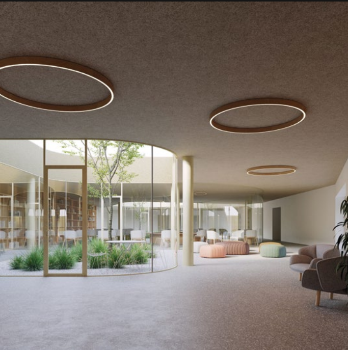
ASILO NIDO - PIEVE DEL GRAPPA (TV)