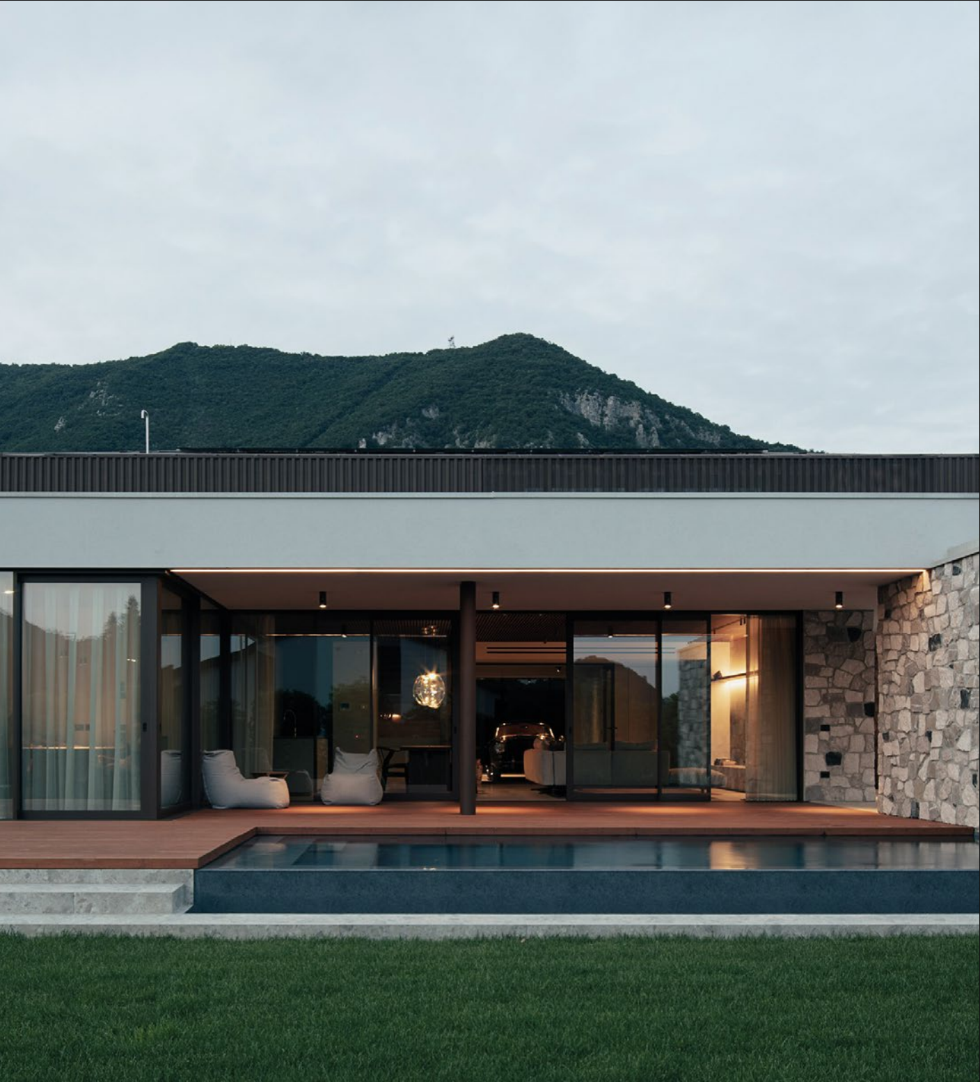
VILLA PRIVATA - POVE DEL GRAPPA (VI)