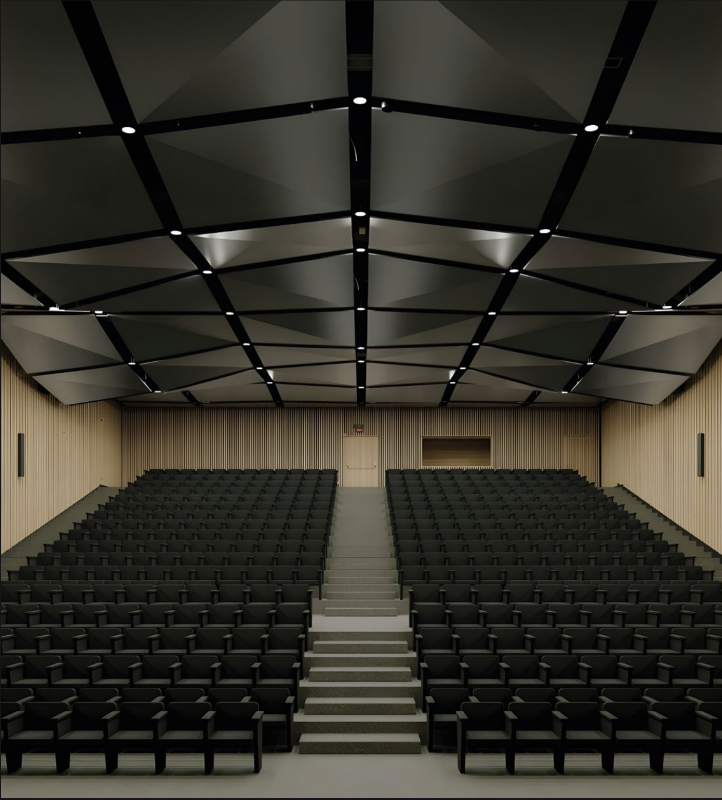
TEATRO AUDITORIUM - ALBIGNASEGNO (PD)