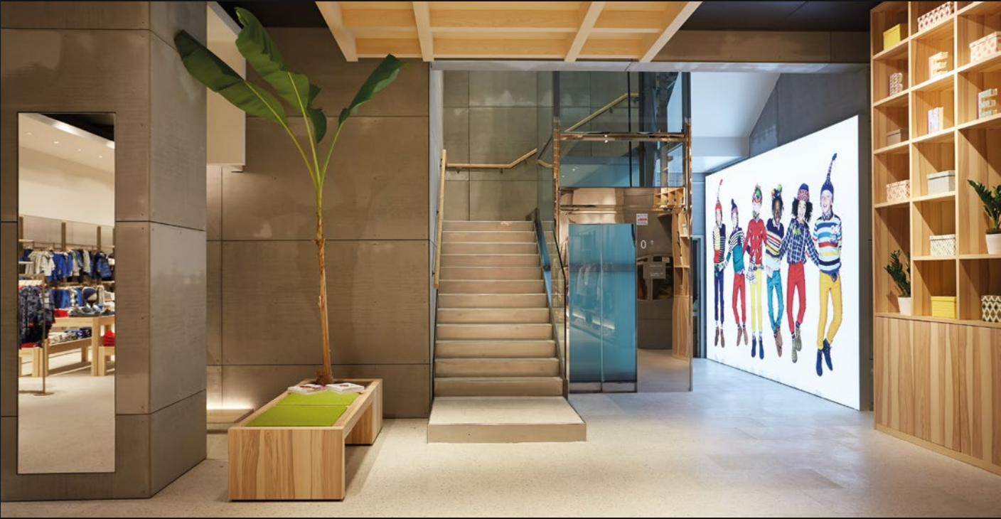
BENETTON - TORINO (TO)