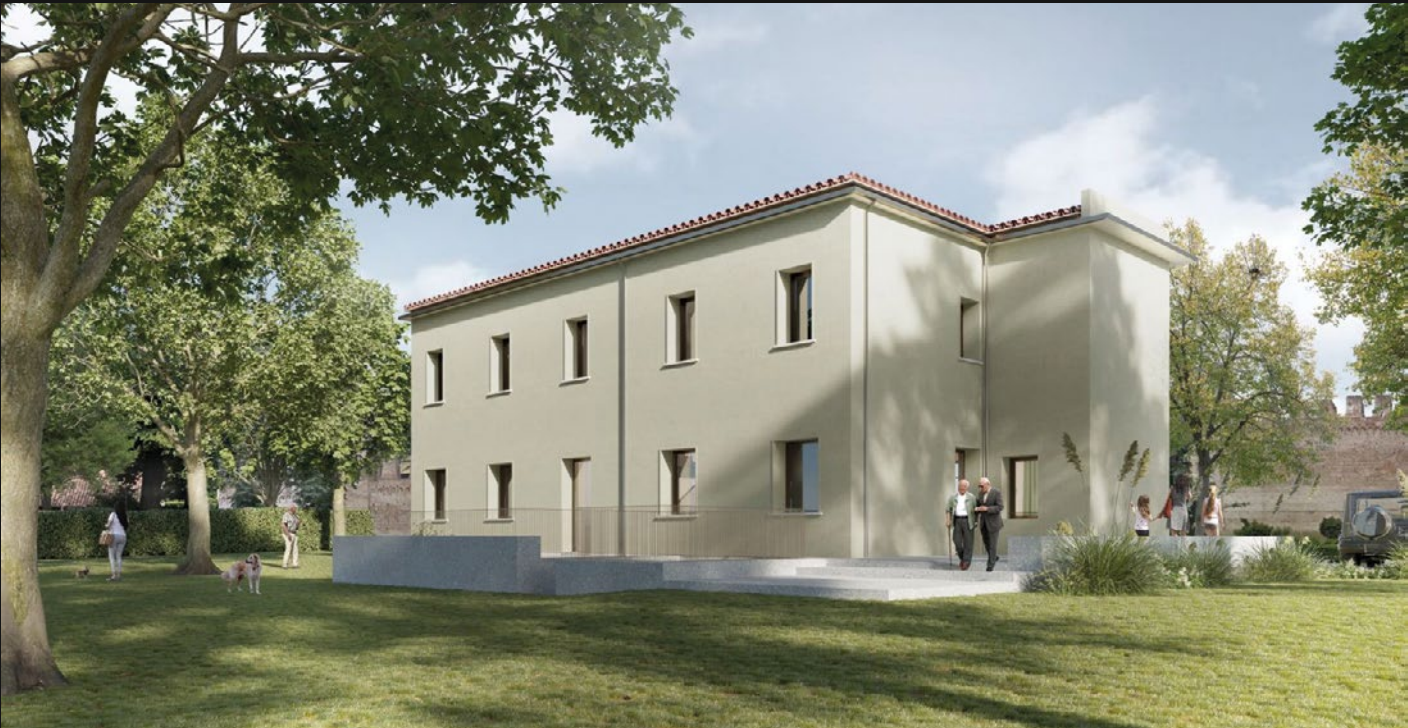
CENTRO CIVICO - CITTADELLA (PD)