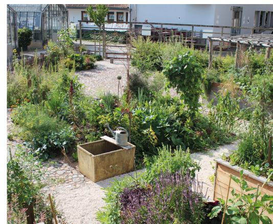
Floricoltura e Paesaggistica