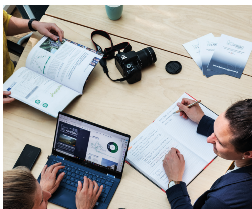
Amministrazione, Servizi Tecnici, Science Support, Strategy and Communication