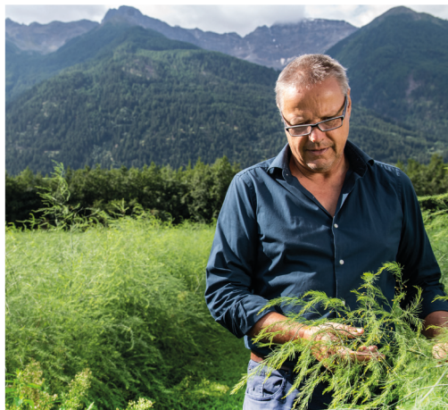
Foraggicoltura, Colture Aromatiche e Piante Aromatiche, Orticoltura