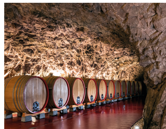
Cantina vinicola provinciale