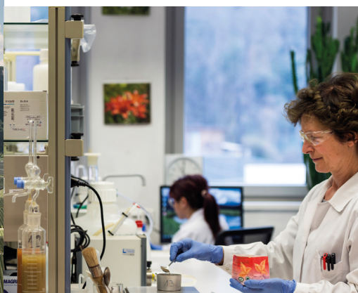
Chimica Agraria, Biologia Molecolare e Microbiologia, Chimica Alimentare