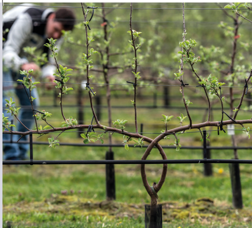
Frutti- e Viticoltura, Enologia