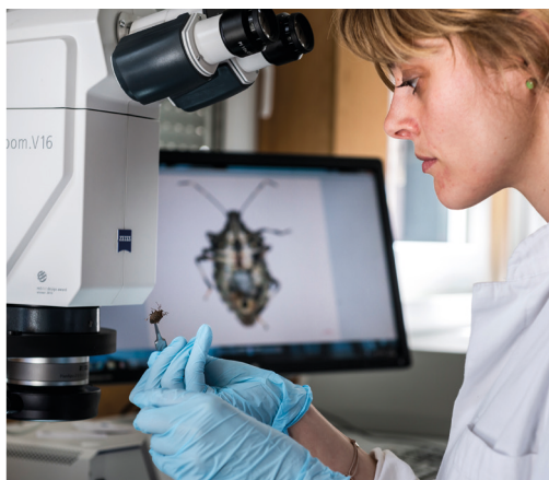
Salute delle Piante